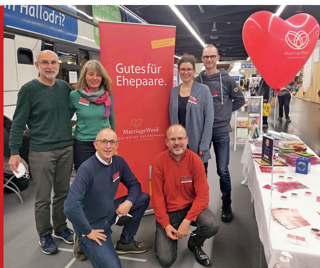
Team der MarriageWeek Nürnberg und Stein auf der Consumenta 2021

Sprecher für den MarriageWeek-Trägerkreis Region Nürnberg